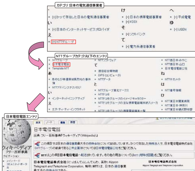
図 1: Wikipedia の構造